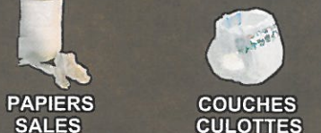
PAPIERS SALES COUCHES CULOTTES