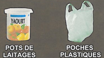
POTS DE LAITAGES POCHEs PLASTIQUES