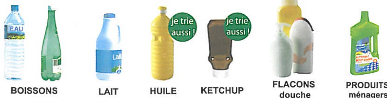
BOISSONS LAIT HUILE KETCHUP FLACONS douche PRODUITS ménagers