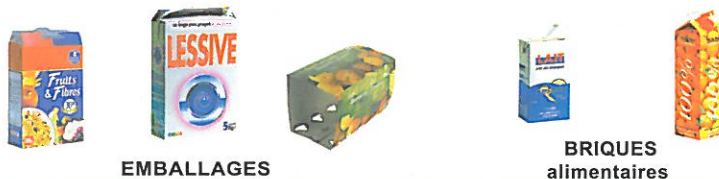
EMBALLAGES BRIQUES alimentaires

tous les papiers se trient et se recyclent