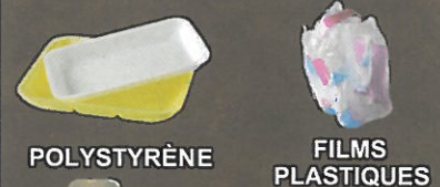
POLYSTYRÈNE FILMS PLASTIQUES