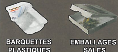
BARQUETTES PLASTIQUES EMBALLAGES SALES