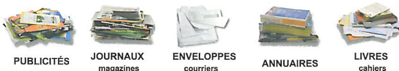
PUBLICITÉS JOURNAUX magazines ENVELOPPES courriers ANNUAIRES LIVRES cahiers