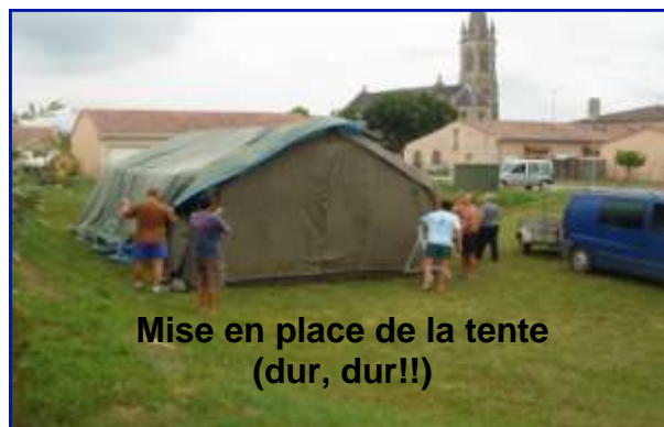
Mise en place de la tente (dur, dur!!)