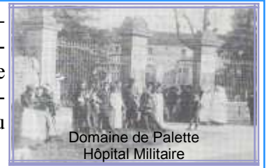
Domaine de Palette Hôpital Militaire

Du 8 au 11 novembre 2008, le Cercle Généalogique Historique Garonnais organisait à la salle des fêtes de Béguey, l'exposition sur le 90 ème anniversaire de la guerre de 14-18. De nombreux visiteurs, dont l'école primaire de Béguey ont contribué au franc succès de cette manifestation qui s'est achevée le 11 Novembre, jour de la commémoration et inauguration du nouveau monument aux morts.